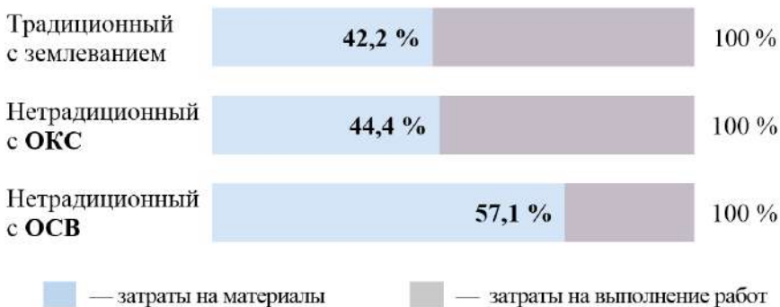
Рис. 23. Структура затрат на осуществление этапов создания посевного фитоценоза разными способами на техногенном грунте хвостохранилища

Необходимо подчеркнуть, что в случае использования мелиоранта ОСВ основным ценообразующим фактором являются затраты на приобретение семян, которые составляют 57,1 % от их суммарной стоимости. Затраты на работы без стоимости материалов, включающие посев семян без заделки граблями и прикатывания и нанесение самого мелиоранта (под слой ОСВ или поверх влажного осадка), составляют 42,9 % от их суммарной стоимости.