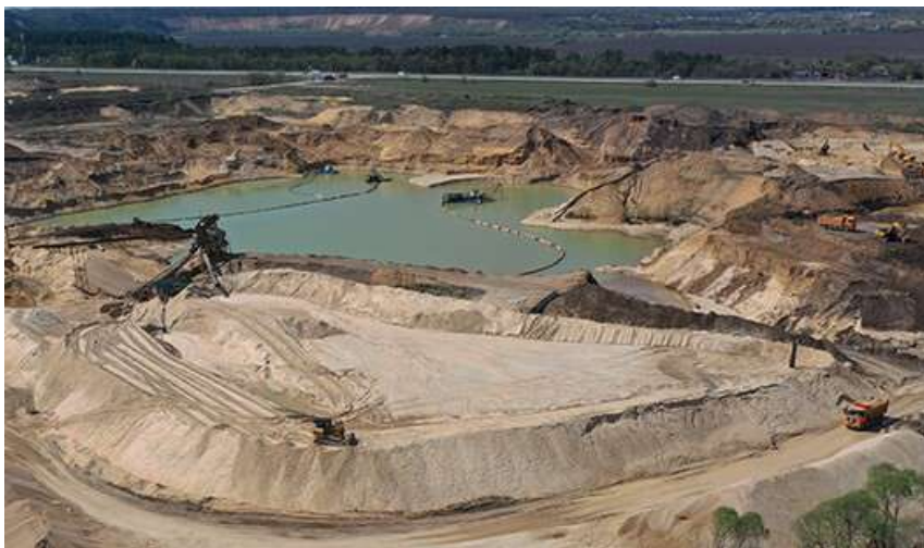
Рис. 1. Разработка карьера по добыче песка — https://vodoroy.ru/vidyработ/dобыча-pgs/karer-po-dобыче-peska.html