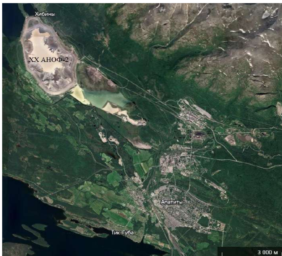
Рис. 3. Карта расположения действующего апатит-нефелинового хвостохранилища (XX) АНОФ-2

ограничена с востока Хибинским горным массивом, а с запада – озером Имандра (рис. 3). Его тип по размещению — равнинный, площадь составляет 7,8 км 2 , а периметр по дамбе обвалования — 11550 м. Это крупнейший намывной техногенный массив в РФ по высоте ограждающей дамбы (более 75 м) и по объему заскладированных в нем отходов (свыше 700 млн м 3 хвостов). Ежегодно с обогатительной фабрики на хвостохранилище поступает более 6 млн м 3 хвостов обогащения [Архипов, Решетняк, 2017].