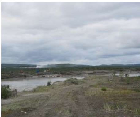
Рис. 10. Самозарастание территории резервного хвостохранилища АНОФ-2 КФ АО «Апатит».