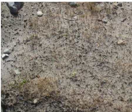
Рис. 11. Естественная группировка растений.

Техногрунты таких категорий нарушенных земель, как песчаные карьеры и отвалы апатит-нефелиновых хвостохранилищ, характеризуются отсутствием органического вещества биогенного происхождения (гумуса), а также пониженным содержанием полезных для растений питательных веществ, и по этим причинам относятся к малопродуктивным угодиям. Поэтому при проведении рекультивационных работ на этих объектах одним из определяющих факторов успешности является питательный режим их поверхностного слоя.