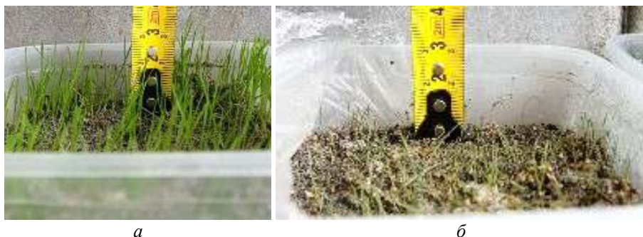
Рис. 18. Внешний вид сформированного фитоценоза: а — опытный вариант (с использованием ОКС); б — контрольный вариант (без использования ОКС).

в искусственно создаваемом фитоценозе. К концу эксперимента высота растительного покрова в опытном варианте по сравнению с контролем была в среднем на 2 см выше, а проективное покрытие — на 17–20 % больше (рис. 18).