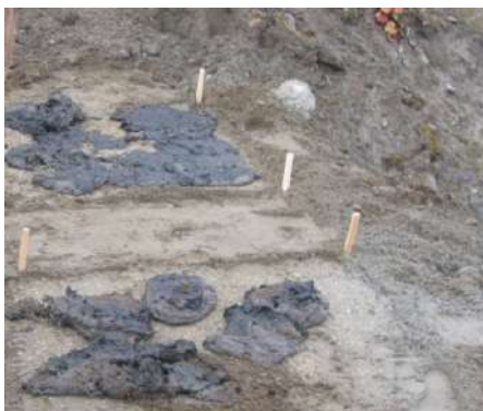
Рис. 20. Фрагментарное нанесение слоя из ОСВ на опытных делянках.

Сложный посевной фитоценоз формировался с помощью подзимнего способа прямого посева травосмеси (рис. 21), разработанной нами на основании биологических характеристик видов многолетних травянистых растений. Она включала 3 вида злаков — овсяницу красную ( Festuca rubra ), волоснец песчаный ( Leymus arenarius ), пырей ползучий ( Elymus repens ) — и 2 вида бобовых растений — люпин многолистный ( Lupinus polyphyllus ), копеечник альпийский ( Hedysarum alpinum ), взятые в соотношении 5:1:1:0.1:0.1 (по объему). Норма высева семян составляла 27,5 г/м 2 . В опытном варианте 1 семена высевались непосредственно на поверхность грунта (под слой ОСВ), в варианте 2 — поверх сплошного 10-сантиметрового слоя ОСВ. Отдельно от травосмеси в нижний правый угол каждой делянки высевали по 6 штук семян сосны обыкновенной ( Pinus sylvestris ).