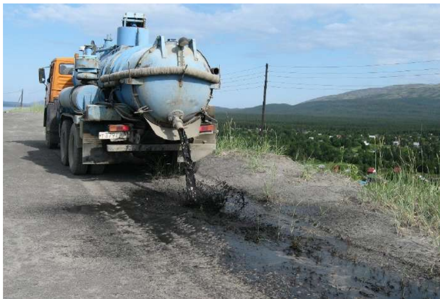
Рис. 7. Закрепление дорожного полотна на хвостохранилище АНОФ-2 с помощью анионной битумной эмульсии.