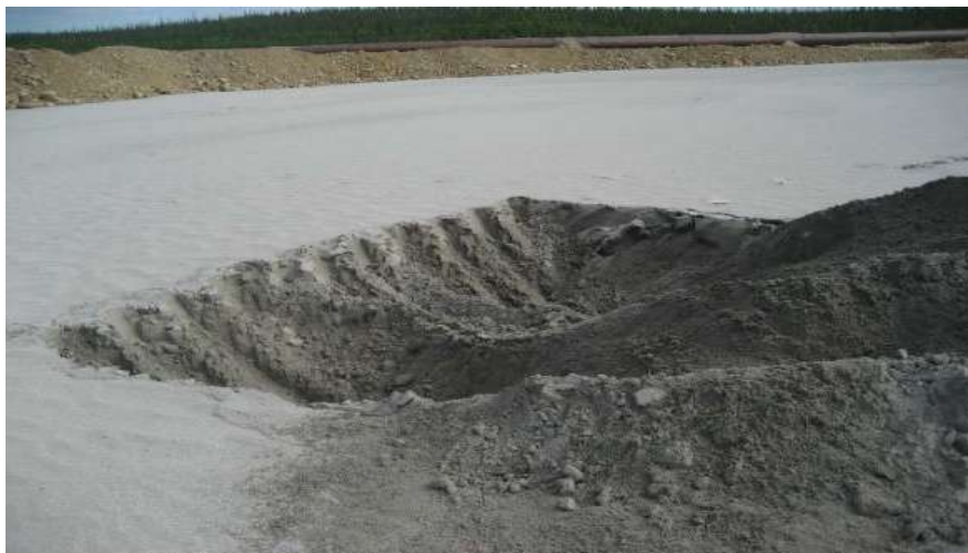
Рис. 4. Внешний вид техногенного грунта хвостоотвалов апатит-нефелиновых руд АНОФ-2.

Хвосты флотации апатит-нефелиновых руд АНОФ-2 представляют собой мелкий несвязный песок серого цвета (рис. 4) крупностью частиц от 0,2 до 1,1 мм и значительным содержанием в них пылеватых фракций. Объёмная плотность сухих хвостов в хвостохранилище составляет 1,54 г/см [Архипов, Решетняк, 2017].