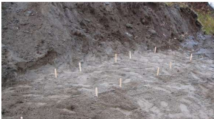
Рис. 19. По периметру участка были сформированы 18 делянок, каждая площадью 1 м 2 .