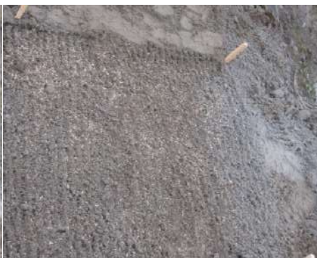
Рис. 21. Прямой посев травосмеси непосредственно на поверхность грунта.

2018 г. Появление первых всходов посеянных растений в эксперименте было зафиксировано во всех трех вариантах одновременно, сразу после схода снежного покрова в мае 2018 г. Однако самые дружные и качественные всходы отмечены в вариантах с использованием ОСВ (табл. 10), что позволило предполагать стимулирующее действие указанного мелиоранта на процесс прорастания семян.