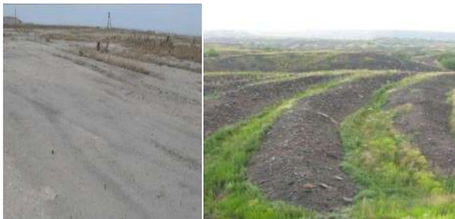
а б Рис. 9. Пример биологической рекультивации хвостовых отвалов традиционным посевным способом с проведением выполаживания и нанесения на поверхность техногенного грунта слоя почвосмеси: а — до начала проведения работ; б — результат после завершения.

Биорекультивация обычно состоит из двух основных этапов — технического и биологического. На техническом этапе проводится корректировка ландшафта и нанесение плодородных пород или почв на поверхность рекультивируемого участка. Биологический этап включает проведение комплекса работ по возобновлению растительного покрова (рис. 9) [Капелькина, 2021].