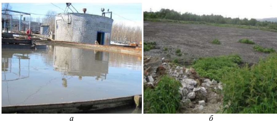
Рис. 15. Водопроводно-канализационное хозяйство АО «Апатитыводоканал»: а — осветление сточных вод на КОС-3 г. Апатиты; б — один из иловых накопителей ОСВ.

Характеристика отходов регионального предприятия ВКХ АО «Апатитыводоканал». Отходами регионального предприятия ВКХ АО «Апатитыводоканал», представляющими интерес для использования в растениеводстве, являются осветленные коммунальные стоки и осадок сточных вод (рис. 16).