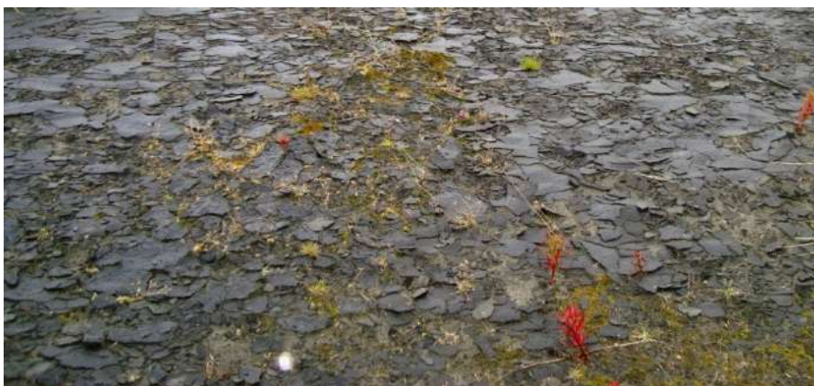
Рис. 8. Результат применения анионной битумной эмульсии для пылеподавления на резервном хвостохранилище АНОФ-2.