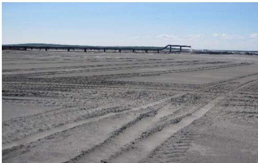
Рис. 2. Песчаный пляж одного из апатит-нефелиновых хвостохранилищ АО «Апатит».