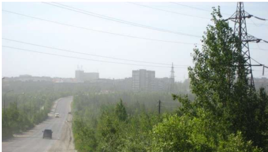
Рис. 6. Пыление отвалов хвостохранилища АНОФ-2, достигающее г. Апатиты.