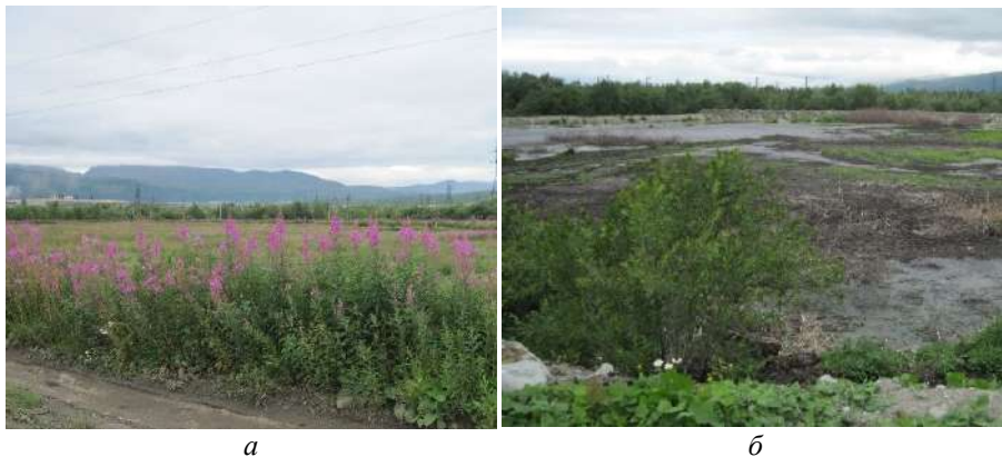
Рис. 17. Самозарастание иловых карт АО «Апатитыводоканал»: а — иван-чаем узколистным ( Chamaenerion angustifolium ); б — мать-и-мачехой обыкновенной ( Tussilago farfara ), бескильницей расставленной ( Puccinella distans ) и другими видами травянистых растений.

О высокой продуктивности ОСВ, депонируемого АО «Апатитыводоканал» на иловых картах, также говорит и их активное самозарастание (рис. 17).