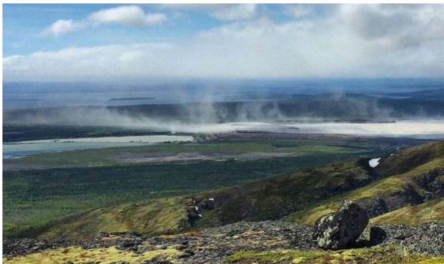
Рис. 5. Пылеунос с хвостохранилища АНОФ-2.

Следствием нарушения экологического состояния воздушного бассейна региона является ухудшение условий нормальной жизнедеятельности человека, организмов флоры и фауны [Кириллова, 2006], что требует проведения на объектах накопленного ущерба экологических мероприятий по пылеподавлению [Комонов, Комонова, 2008].